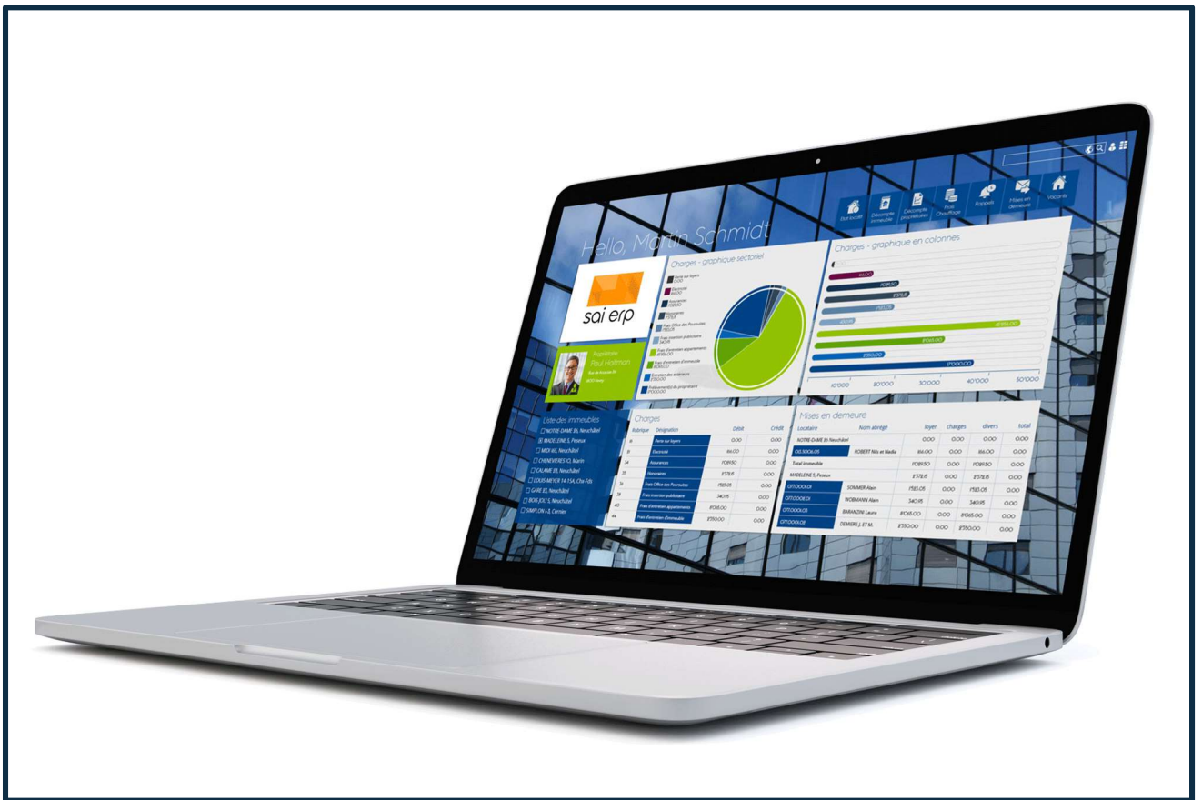
Figure 1 Application desktop SAINet pour l'administration