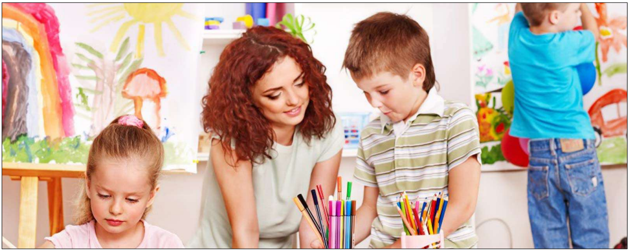
Le personnel encadrant s'implique émotionnellement auprès des enfants

Dans la vie d'un enfant, les structures d'accueil de jour pré et parascolaires sont des lieux qui comptent. Il côtoie le personnel encadrant, auquel il s'attache et inversement.