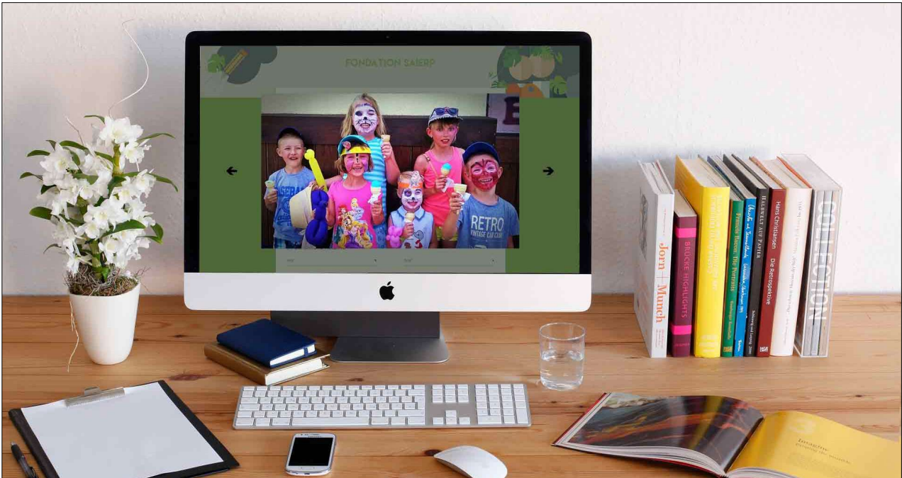
Galerie Photos de l'application

Il y a un certain nombre d'informations administratives qui peuvent être mis à disposition des parents. Bien que cela soit décrié par certains, il paraît évident de donner accès au journal de vie de l'enfant, comme les activités auxquels les enfants ont participé. Et s'il y a des photos c'est tant mieux, cela fait des souvenirs.